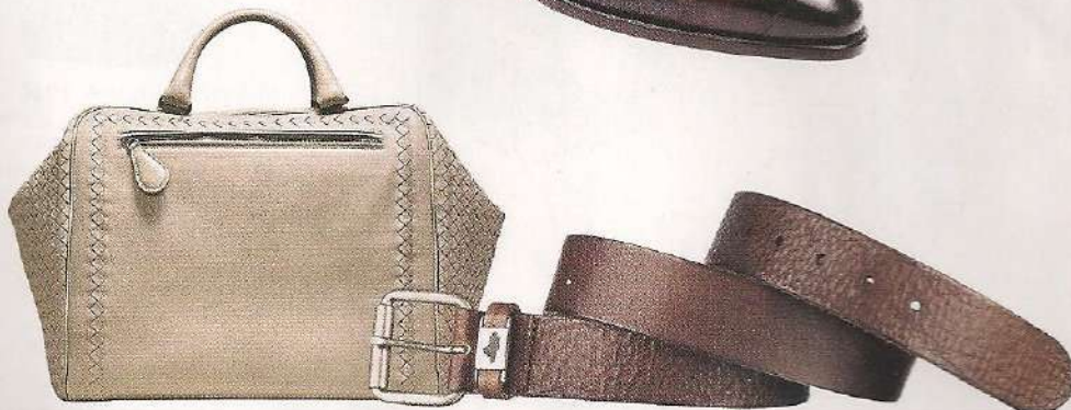
Sac Brera en cuir madras, 2 650 €, Bottega Veneta. www.bottega.veneta.com