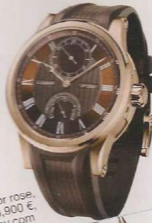
Montre Marine, boîtier en or rose, bracelet en caoutchouc, 23,900 €, L. Leroy. www.montres-leroy.com