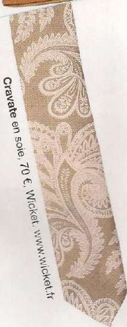
Cravate en soie, 70 €, Wicket. www.wicket.fr