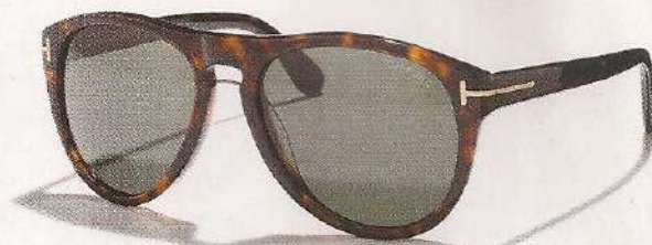
Lunettes de soleil en acétate, 258 €, Tom Ford. www.tomford.com