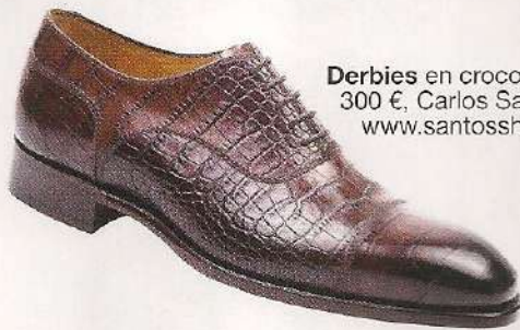
Derbies en crocodile, 300 €, Carlos Santos. www.santosshoes.com