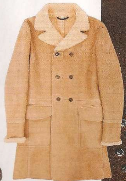
Manteau en peau lainée, 4 350 €, Façonnable. www.faconnable.com