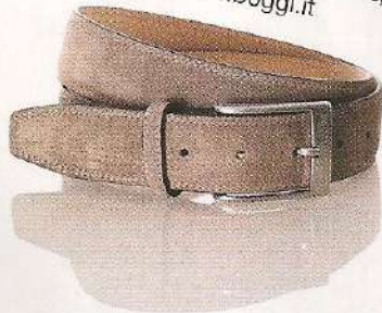
Ceinture en nubuck, 55 €, Boggi. www.boggi.it