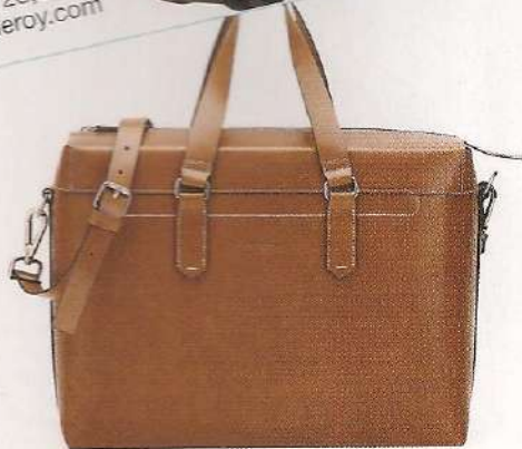
Cabas en cuir, 1 250 €, Salvatore Ferragamo. www.ferragamo.com