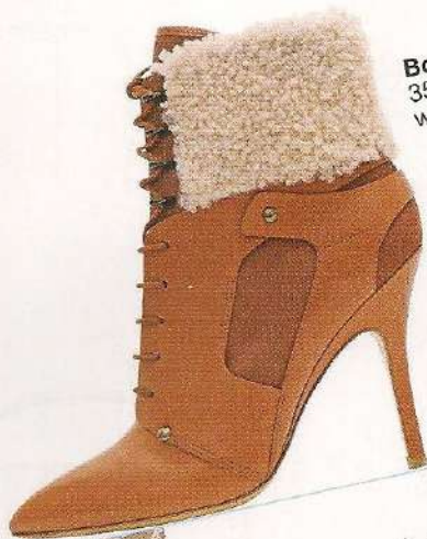
Boots en cuir et peau lainée, 350 €, Stella Luna. www.stellalunafashion.eu